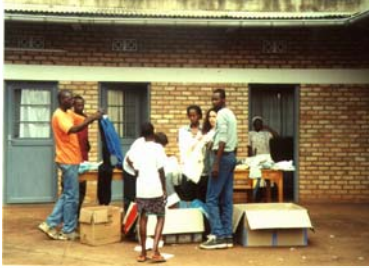
Distribution à l'orphelinat (Janvier 2002)

Du 19 juin au 3 juillet 2001, nous étions 5 à nous rendre au Rwanda afin d'accomplir notre mission dans le cadre de notre projet « Pacte » au sein de l'ESC Dijon : distribuer en mains propres 5 tonnes de vêtements et de fournitures scolaires auprès des enfants de Butare.