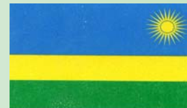
Vert : l'ikizere (Espoir) Jaune: le bié (Fertilité) Bleu: l'eau

Lors de notre rencontre à Cologne il est devenu évident que ceci tous ces moments intenses étaient à préserver et à diffuser. Pour cela, les archives des photos et du film seront créés afin de partager ces souvenirs.